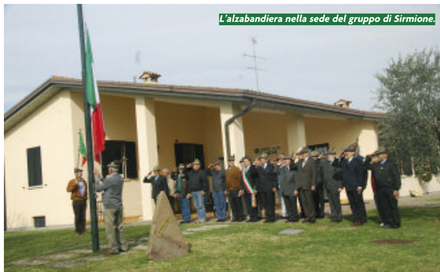
L'alzabandiera nella sede del gruppo di Sirmione.