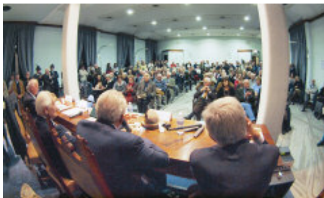
Nelle foto, una singolare veduta della sala e il tavolo dei relatori e del reduce.

La presentazione del volume – avvenuta con il sostegno della Banca di Romagna – è stata arricchita dagli interventi di alpini e famigliari di reduci “andati avanti”. ●