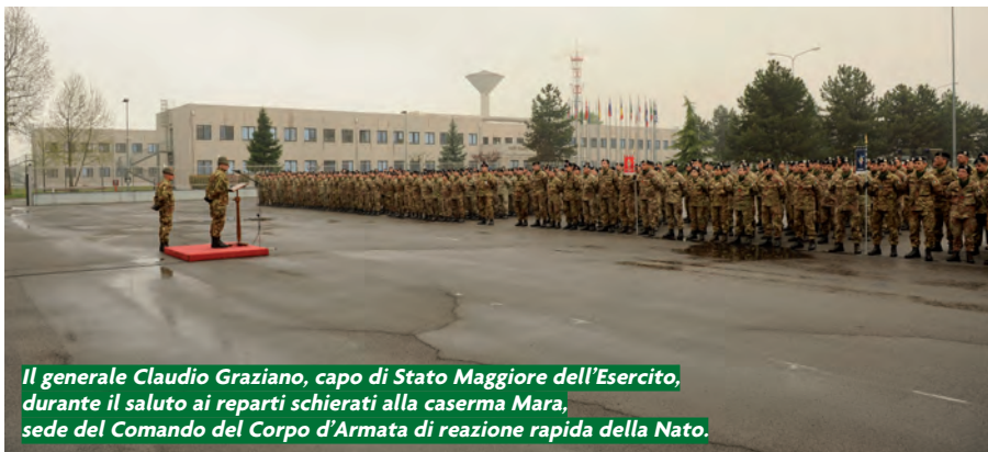
Il generale Claudio Graziano, capo di Stato Maggiore dell'Esercito, durante il saluto ai reparti schierati alla caserma Mara, sede del Comando del Corpo d'Armata di reazione rapida della Nato.

Sono stati trattati, infine, temi relativi alla partecipazione di alcuni membri dello staff del Corpo d'Armata alla missione Nato in Afghanistan (un'eventualità che potrebbe realizzarsi a fine 2012-inizio 2013) e il possibile trasferimento alla caserma Mara del 1° reggimento Trasmissioni attualmente di stanza a Milano, componente della brigata Trasmissioni che dal 2007 è di supporto al Corpo d'Arma-