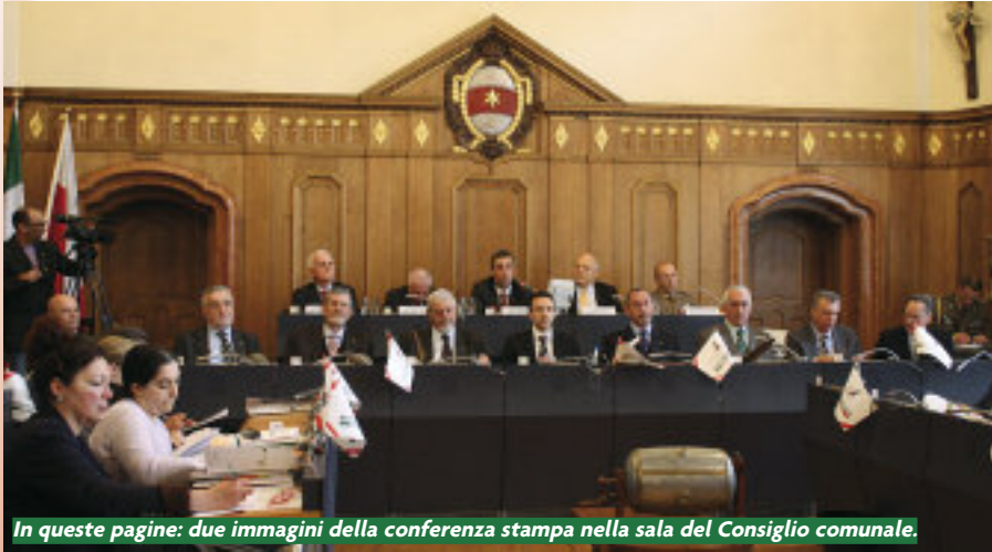
In queste pagine: due immagini della conferenza stampa nella sala del Consiglio comunale.