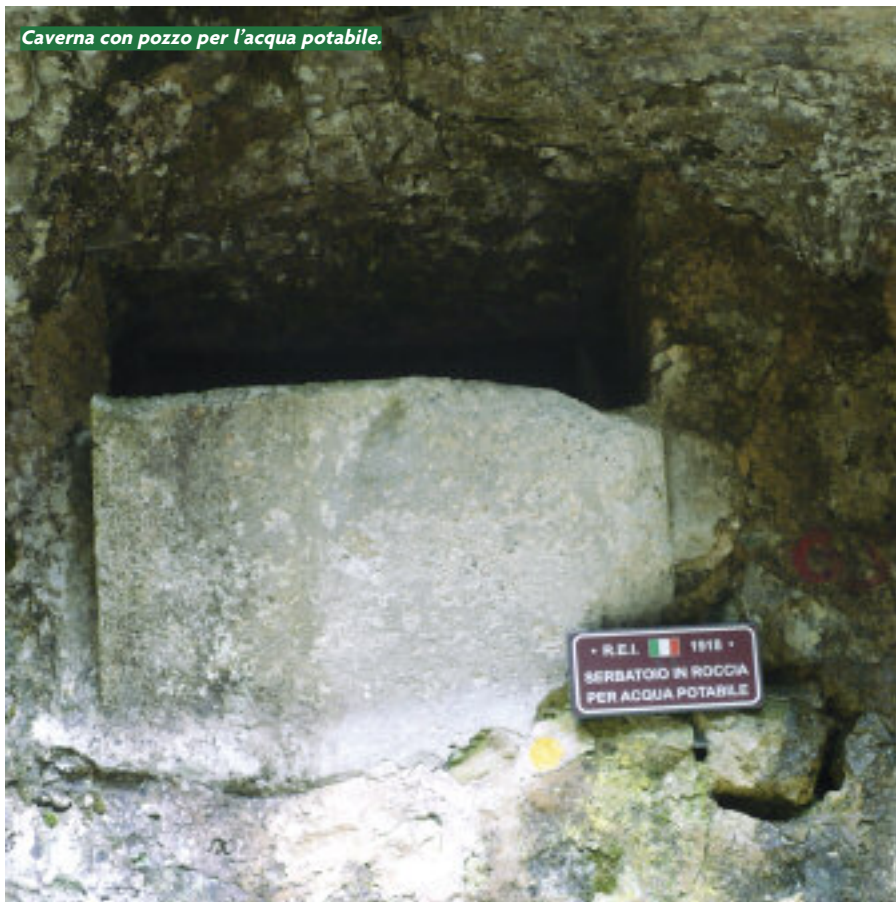
Caverna con pozzo per l'acqua potabile.

• R.E.I. 1918 • SERBATOIO IN ROCCIA PER ACQUA POTABILE