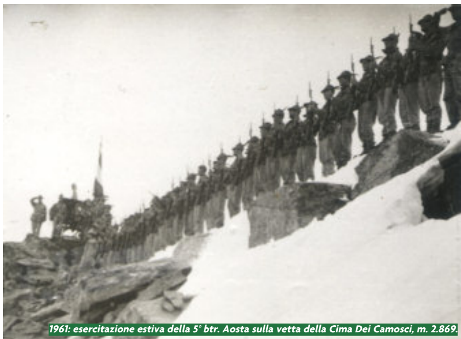
1961: esercitazione estiva della 5° btr. Aosta sulla vetta della Cima Dei Camosci, m. 2.869.

Il 15 aprile la brigata alpina Taurinense ha compiuto sessant'anni. Una ricorrenza che è un'occasione per ripercorrere in breve la storia di una delle grandi unità d'élite dell'Esercito di oggi