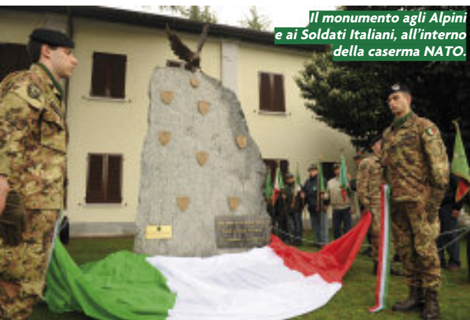
Il monumento agli Alpini e ai Soldati Italiani, all'interno della caserma NATO.

La razionalizzazione dello strumento militare è stato l'aspetto centrale del colloquio del capo di Sme con i giornalisti, incontrati al circolo Ufficiali della base. La ricetta indicata è stata quella di "ottenere il meglio con quel poco che si ha". Gli ingredienti sono la riduzione della forza bilanciata (attualmente circa 103mila effettivi), la vendita delle caserme inutilizzate ai Comuni o ad altre istituzioni civili e, infine, l'accorpamento di reparti diversi in un'unica struttura.