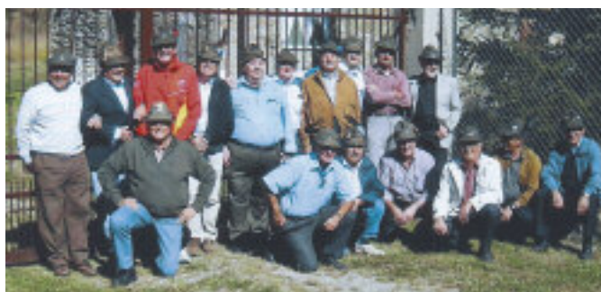
Incontro a Pradelato, in Val Chisone, dove negli anni 1964-65 avevano partecipato al corso sciatori, nella 36ª cp., btg. Susa.