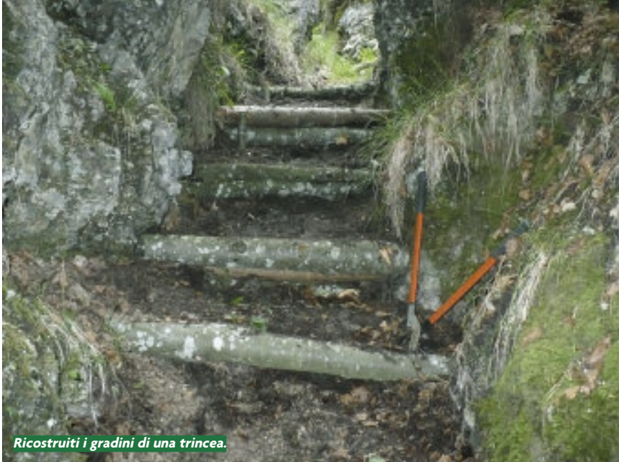
Ricostruiti i gradini di una trincea.

cippo commemorativo dove venne fermata l'avanzata austriaca, è a circa due chilometri di distanza.