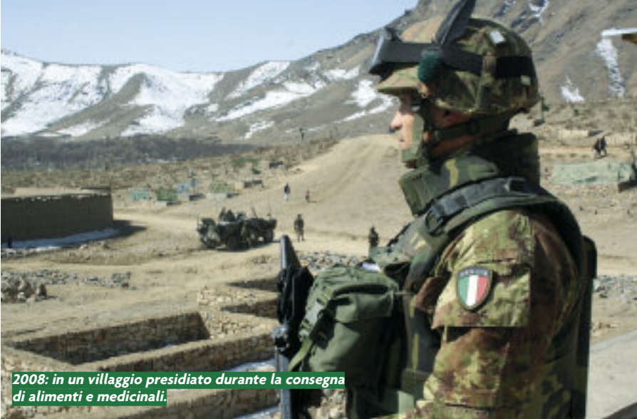
2008: in un villaggio presidiato durante la consegna di alimenti e medicinali.

Il decennio successivo porta cambiamenti epocali, che scaturiscono in parte dalla fine dell'ordine mondiale bipolare: la Taurinense è tra le prime brigate dell'Esercito a passare gradualmente al modello professionale, anche se è con gli alpini ancora di leva che la Taurinense condurrà con successo la missione ONU in Mozambico nel 1993, prima degli impegni in Bosnia-Erzegovina tra il '97 e il '98 alla guida della Brigata Multinazionale Nord a Sarajevo con il generale Armando Novelli. Tra il '92 e il '93 tornano in vita i gloriosi 2° e 3° Alpini insieme al 1° da montagna, che inquadrano rispettivamente i battaglioni Saluzzo, Susa e il gruppo Aosta, mentre nel 1997 il 9° reggimento dell'Aquila entra nei ranghi della Taurinense dopo una lunga e onorata militanza nella Julia.